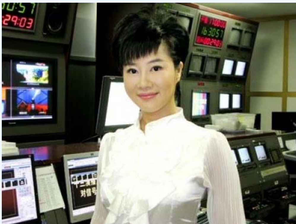
央视女主播叶迎春