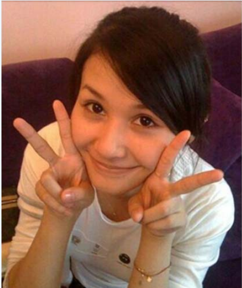
周永康妻子贾晓烨微博私照。

随着周永康被抓，第二任老婆的秘密情史也被曝光。 海外 媒体透露，当年周永康为娶小他 28 岁的央视美女主持人贾晓烨，涉嫌制造车祸，谋杀原配妻子王淑华。