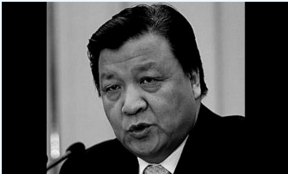
中共现任政治局常委 刘云山