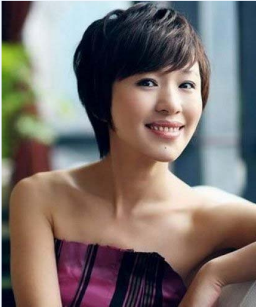
央视主播欧阳夏丹卷入周案。

2003 年 8 月欧阳夏丹进入央视经济频道，主播经济频道早间资讯栏目《第一时间》，此时她与中宣部副部长李东生结识，并成为李东生的情妇。2009 年 7 月她进入央视主干节目新闻频道、主播《共同关注》，也是在同一年，李东生调入公安部任职。