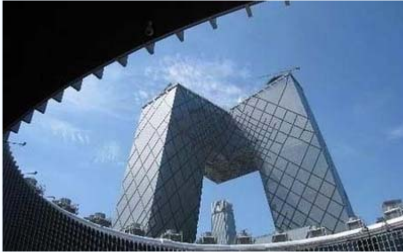
中共央视大楼因其外形酷似人的“大裤衩”，一直为民众诟病。（网络图片）