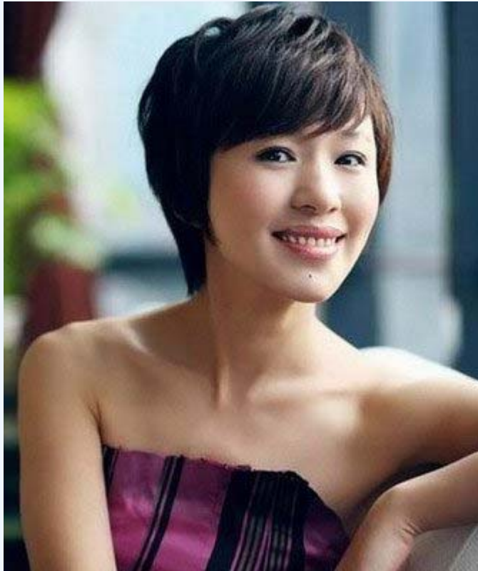
中国新国脸 央视女主播欧阳夏丹

欧阳夏丹 1977 年 7 月出生，广西桂林人。1995 年她以桂林市文科状元考入北京广播学院，1999 年毕业后到上海电视台新闻综合频道工作，曾主播过《上海早晨》、《新闻夜线》等节目。