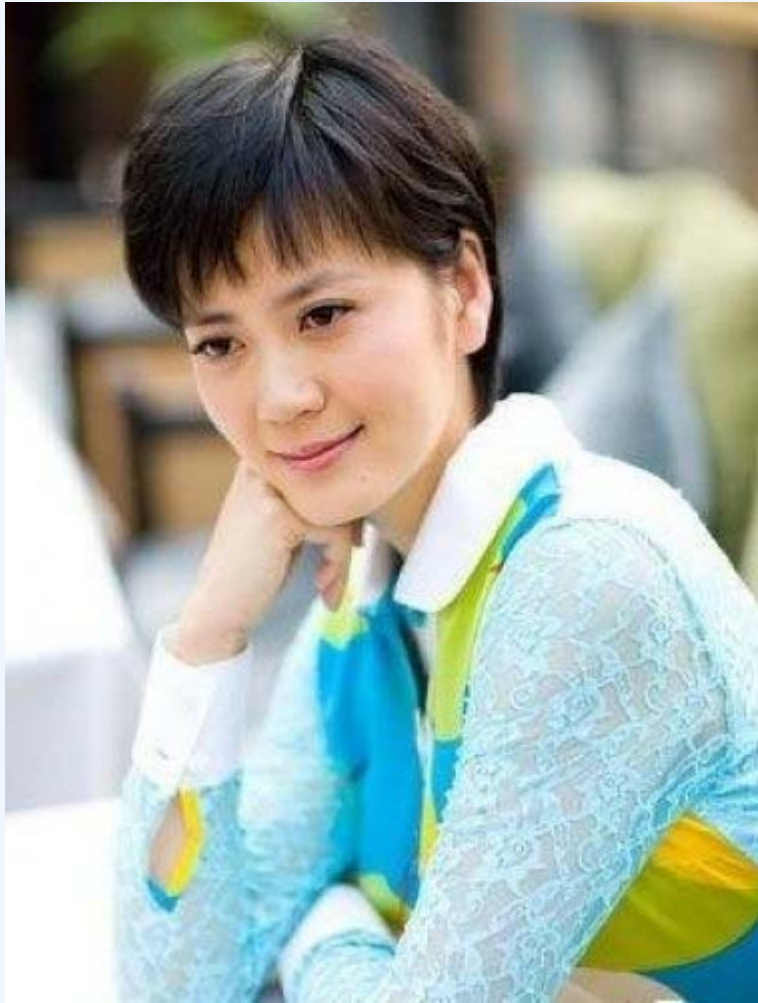
原中央电视台主持人沈冰。

原中央电视台主持人、中共中央政法委信息中心副主任沈冰的背景生不可测。有消息人士透露，沈冰经李东生介绍，加入了周永康情妇队伍，并在周永康的安排下出任政法委信息中心副主任。