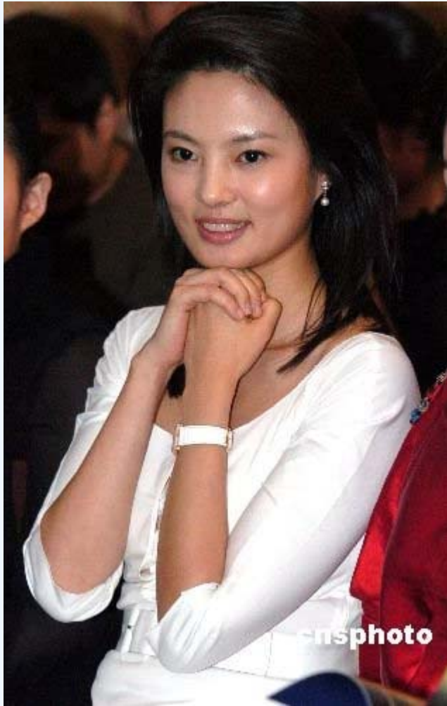
原央视主持人刘芳菲。

曾连续主持 3 年新年 晚会 的央视主持人刘芳菲，因曝涉 性贿赂 薄家“家臣”王益丑闻，后再牵出与薄熙来及周永康均有特殊关系。