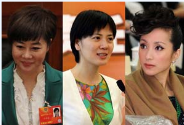
12 月 6 日，当局通报中共前政法委书记周永康与多名女性通奸并进行权色、钱色交易。图为传与周有染的央视女主播叶迎春（左）、沈冰（中）和汤灿（右）。

据港媒《动向》杂志披露，随着官职升迁，周永康从未停止强奸、玩弄女性，其分别在沈阳、大连等多地玩弄女性，和 27 名女性通奸。报导还称，周永康从 2005 年 3 月以来长期患有性病。