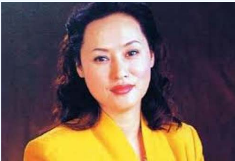
四川美女富商何燕

海外媒体分析指，港媒所指“天府美女富豪”H，是指四川女富豪、国腾实业集团董事长何燕。1961 年生的何燕，曾多次上榜福布斯中国富豪榜和胡润百富榜。2006 年，还曾被评为胡润榜四川 IT 首富。