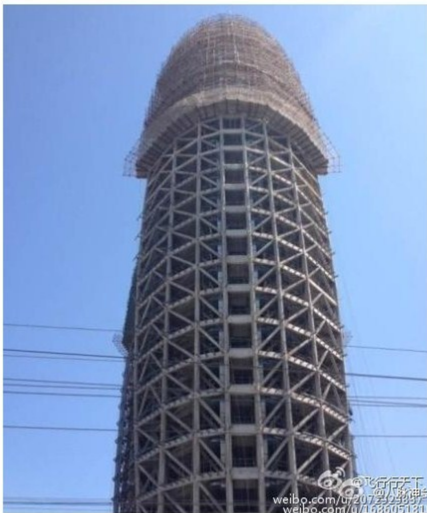
央视“大裤衩”和昔日的 人民日报大楼 常成网友笑柄。