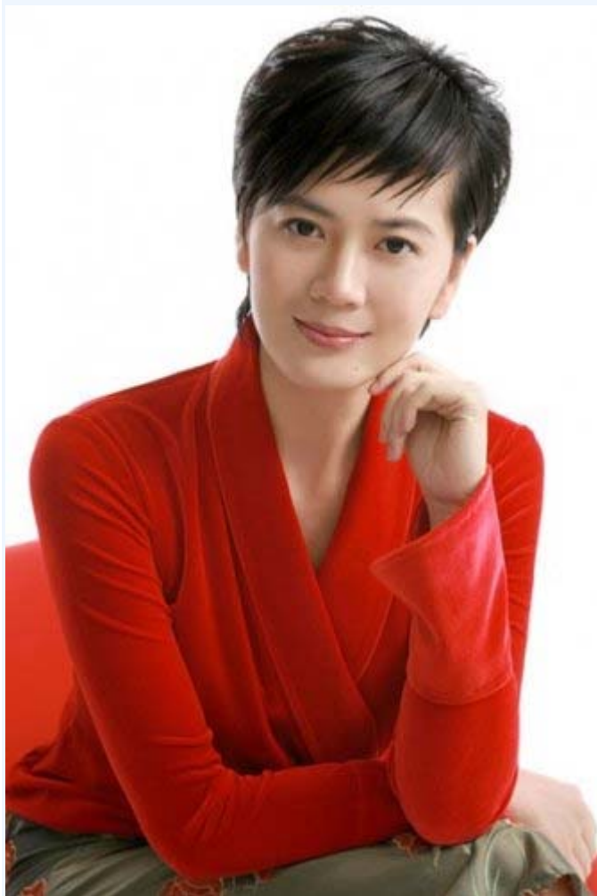
央视女主播沈冰