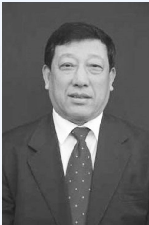
江派常委 刘云山