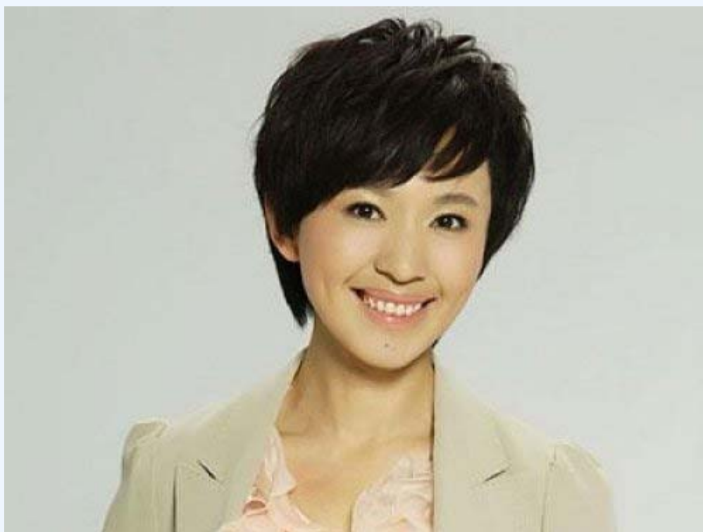
央视女主播欧阳夏丹