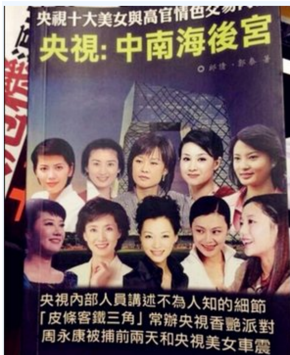
外媒揶揄央视成为中南海后宫。

自中共前政法委 周永康 的数名美女主播情妇，被专案组相继抓走后，又曝出中共政协副主席、 统战 部部长令计划的情人系中央电视台新闻部副主任 冯卓 。消息称，令还与多名央视女主播“有染”。外媒揶揄央视已成中南海后宫。